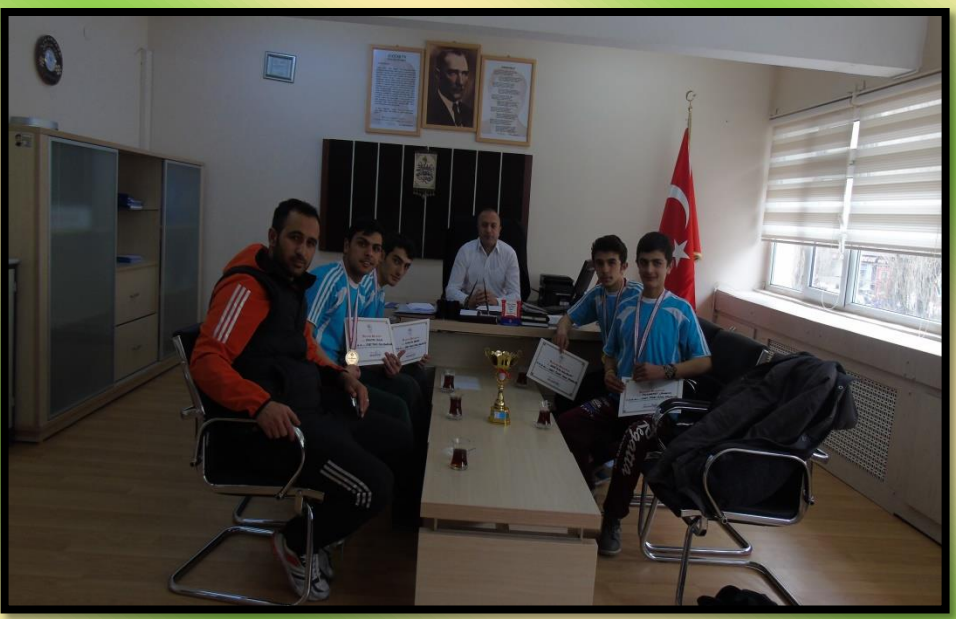
BOKS (Türkiye ve Dünya Şampiyonu – Tuğrulhan ERDEMİR)